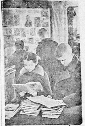
С каждым днем увеличивается приток новых читателей в городской детской библиотеке. На снимке: в детской библиотеке.